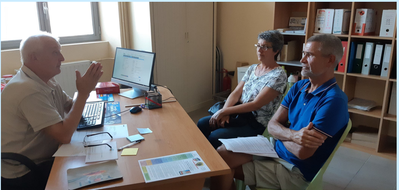
Permanence d'accueil litiges dans nos nouveaux bureaux au rez-de-chaussée de la Maison des Associations à la gare d'Aubenas.